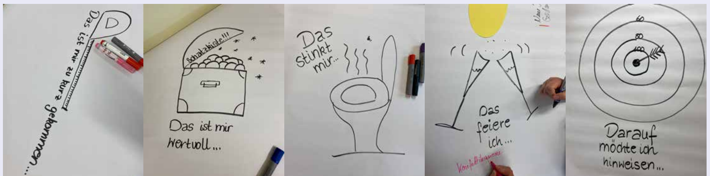
Gestaltung der Plakate: Irmela Redhead, Fotos: Wiebke Johannsen

Die Konfis / alle wandern mit Stiften ausgestattet durch den Raum und schreiben auf jedes Plakat die eigene Antwort. Zum Abschluss werden Auffälligkeiten gebündelt benannt, Alle bekommen die Gelegenheit, sich genauer zu äußern, wenn sie mögen. Die Leitung / Das Team kann sich später alles in Ruhe durchlesen.